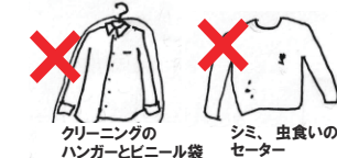
クリーニングのハンガーとビニール袋 シミ、虫食いのあるセーター

★ご家庭で洗濯済みのもの、またはクリーニング済みのものをおねがいします ★シミ、キズ、汚れ、ほつれ、毛玉、伸び、縮み、破損がないものをおねがいします。