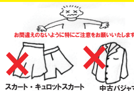
スカート・キュロットスカート 中古パジャマ

受付品目以外のものはJFSAでは活用できません。目的にかなった活用をするために皆様のご協力をお願いいたします。