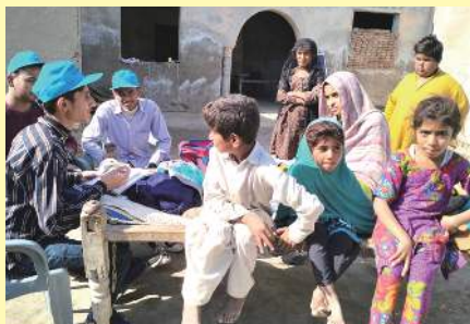
写真…被災した家族から話を聞く 高学年の生徒たち

JFSA千葉センターにて、ボランティアの皆さんと一緒に、25トン605キロの古着をコンテナに積み込み、輸出しました！