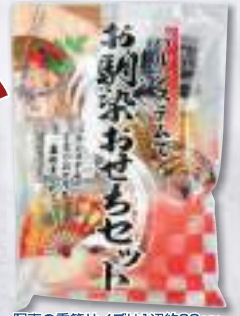
写真の重箱サイズは1辺約20cm。

卵麦豆(えか) 1442kcal◎9.9g/1セット 賞味 1月3日まで M●●●3139518 ●58 ●セ