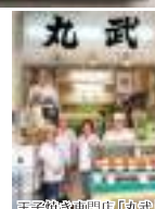
玉子焼き専門店「丸武」