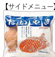
【サイドメニュー】 試食します♪