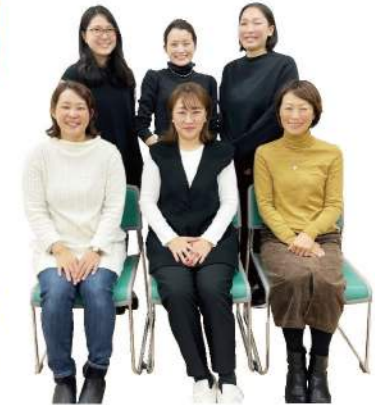
バルシステム千葉の商品開発チーム(2023年度) 「サクッとほっこり」かぼちばちゃん」の皆さん

開発メンバーのお子さんが発案、広報サポーターがイラスト化して完成したコラボキャラ。