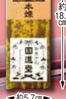
〈回進堂〉 〓 岩手