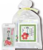
〈玉屋総本店〉 〓 山形