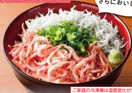
〈釜揚げしらす・釜揚げ桜えび調理例〉

ご家庭の冷凍庫は温度変化が大きいため、賞味期限にかかわらずお早めにお召し上がりください。