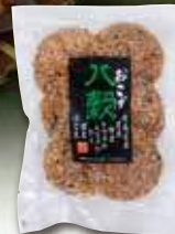
〈山香煎餅本舗〉 〓 埼玉

【賞味期間】120日 【アレルギー】麦 豆 (え) 317kcal/0.8g/1袋 (80g)