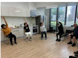
▲「シルバーピラティス」の様子