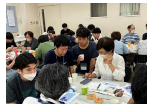
▲「スマホカフェ」当日の様子

シニア食堂®は2017年より、シニアのQOL向上と心身のフレイル予防を目指して、料理交流会からスタート。現在は「好奇心」をキーワードに毎月、シルバーピラティス、地元大学生とコラボした「スマホカフェ」も実施しています。