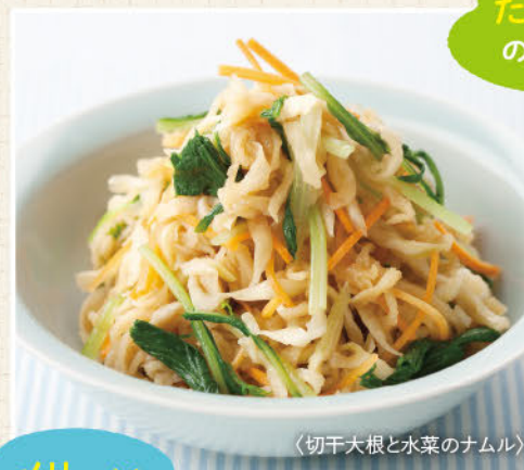
〈切干大根と水菜のナムル〉