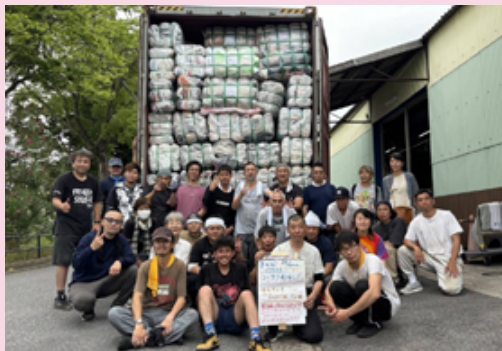
【写真】 第86回コンテナ送り出し 2024年6月20日 パキスタンへコンテナを送り出しました！ 今回もたくさんのボランティアの方の協力がありました！ 8月21日にカラチに到着しました。