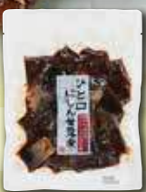
〈かねづん梅屋〉愛知県

【賞味期間】180日 【アレルギー】麦 豆 276kcal④3.0g/100g ※魚の小骨が含まれている場合がございますので、お召し上がりの際はご注意ください。