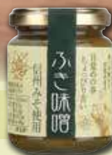
〈須坂食品工業〉長野県