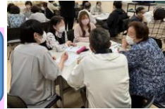
▲「スマホカフェ」の様子

◆会場:江戸川大学 E棟2階 E211教室 ◆主催:江戸川大学情報文化学科 *駐車場のご用意はありません。公共交通機関・大学スクールバスをご利用下さい。 *参加を希望される方は下記のフォームにご記入お願いいたします。 https://forms.gle/rnZiRPP9mgPJGGYu9 →右記の二次元コードからもOK