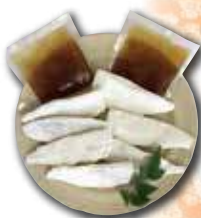
〈つかさ食品〉産千葉