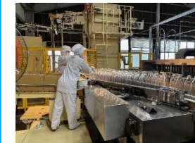
便利つゆの瓶が流れています。

11月15日（金） バス研修企画として、香取市にある（株）にんべんフーズちば醤油工場へ見学に行ってきました。昼食は「発酵の里 こうざき」へ行きました。皆さん、勉強になり尚且つ美味しい昼食で満足されたようです。