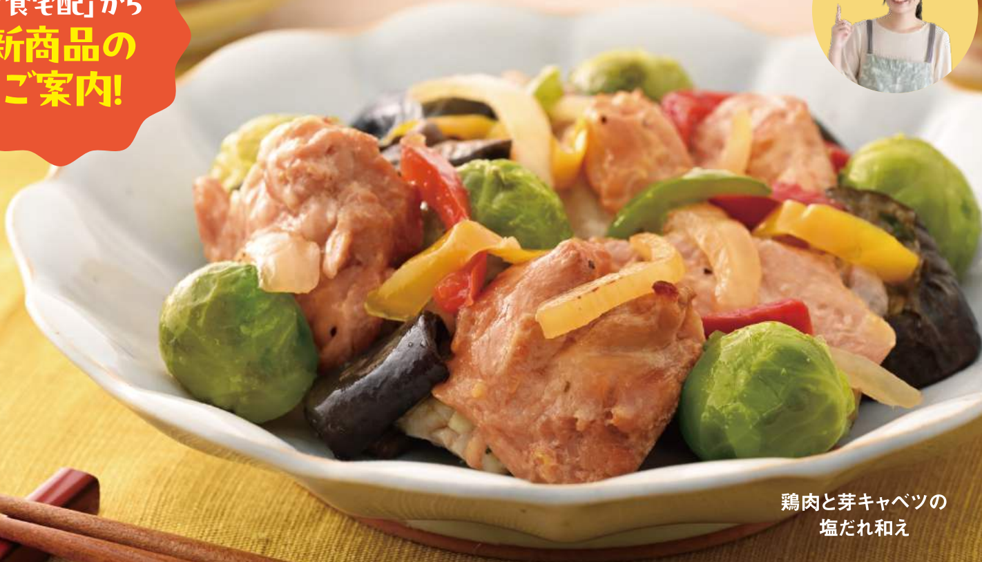
鶏肉と芽キャベツの 塩だれ和え