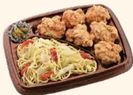
⑮鶏の唐揚げと塩焼きそば