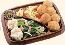
①コーンたっぷりフライとタンドリーチキン