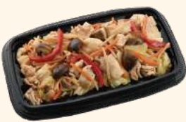
④豚肉としいたけのオイスターソース炒め