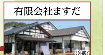
有限会社ますだ 昔ながらの天日干し製法に70余年こだわっています。この製法により、うまみ、甘みが増してより味が凝縮された落花生がでか上がります。