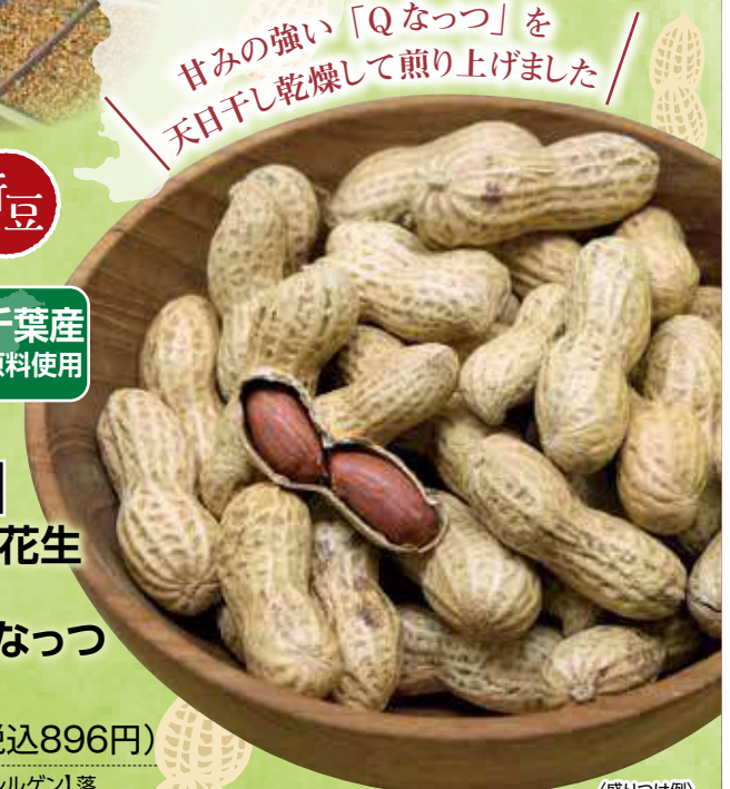
甘みの強い「Qなっつ」を天日干し乾燥して煎り上げました