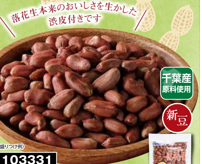
落花生本来のおいしさを生かした 渋皮付きです