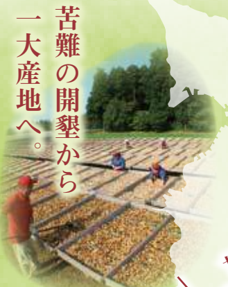
(天日干しイメージ)

Pal's Diningお楽しみ企画! 探して当てよう! 2025年 今年の干支はど〜こだ? 詳細は8ページをご覧ください