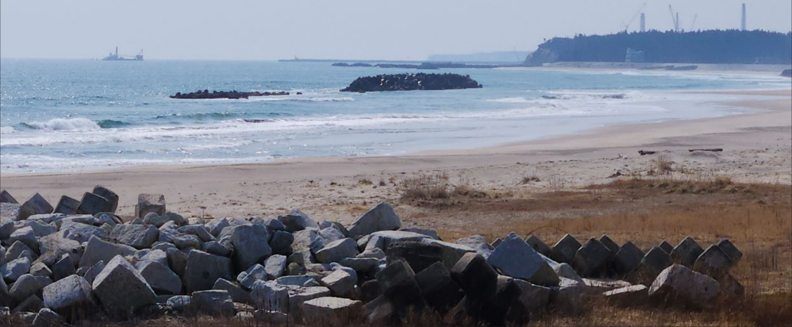
■福島の写真(福島第一原発と放出口)