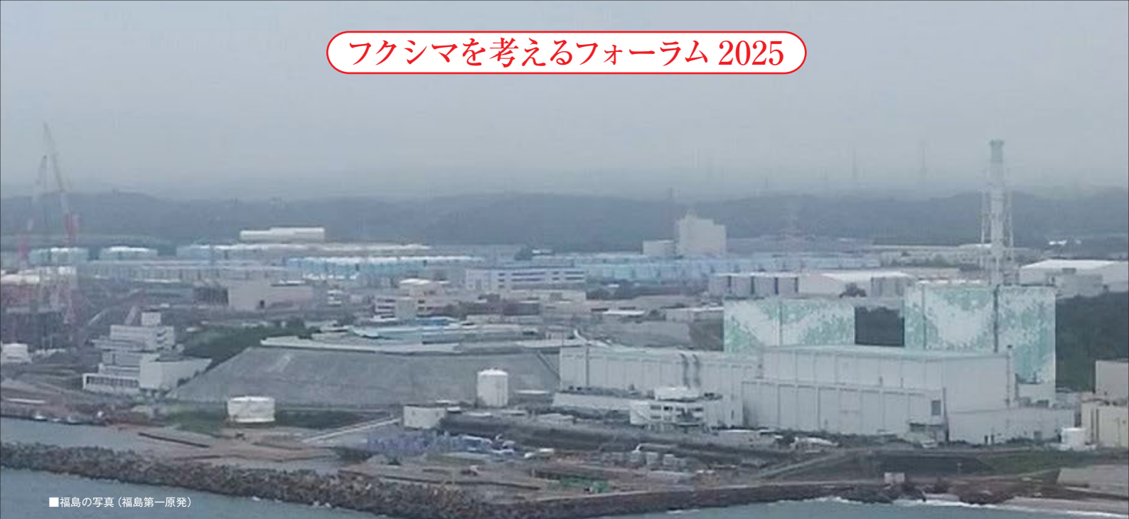
■福島の写真(福島第一原発)