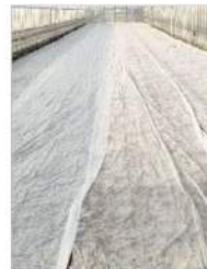
不織布の下で成長中

寒い時期のお野菜の様子をご紹介します！12月に入ると野菜たちの上に不織布をかけます。不織布はティッシュのように繊維を絡めてシート状にしたもので、冬ならではの光景です。不織布をかけると、ハウスの中の野菜たちはまるでお布団をかけているような状態になり、中が保温保湿されるため凍結しにくくなるだけでなく、種まき後の発芽や生育を促すことができます。それでも厳寒期は凍結してしまうこともありますが、大地に根を張った作物の生命力はたくましく、少しくらい凍結しても溶けては伸び、伸びては凍りを繰り返しながらゆっくりと育っていくのです。