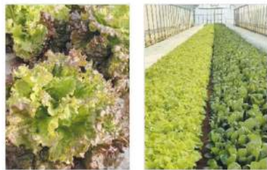
サニーレタス ベカ菜・小松菜