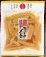
〈マルアイ食品〉印新潟

【賞味期間】150日 【アレルギー】麦 豆 72kcal/袋2.0g/1袋90g