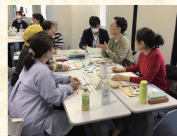
「くらしトーク・トーク」の運営