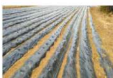
じゃがいも畑、植え付け完了

パルグリーンファームでは、古民家前の梅の花が咲き始めました。虫たちも活動を開始し、野菜に付いた虫を発見するようになりました。圃場全体を見回しても枯れ草の薄い茶色から明るい新緑色へと変わり始めています。冬から春にかけての季節の変わり目は野菜が凍るほど寒い日もあれば、ハウスを締め切ると葉が焼けてしまうような初夏を思わせる陽気の日もあり室温管理に気を遣います。夏に向けて育苗しているなすやピーマンは寒さに弱く、寒気に当たただけで枯れてしまうことがあります。その一方、葉物野菜のようにハウスの室温が上がって春を感じると花芽を付け、出荷できなくなってしまうこともあります。近年は冬季から初夏への気温の変化が急激で、これまでよりも早いうちに作付けを済ませることが重要になってきました。