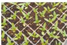
すくすく育つピーマンの苗

じゃがいもの圃場整備から植え付け、続いて里芋畑・さつまいも畑の準備、苗床で着々と育っているなす・ピーマンなどの夏野菜を植え付ける畑の準備を急ピッチで進めています。虫や草花に負けじと温暖期に向けて活発に動いていきます！