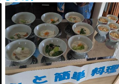
出来上がりました！