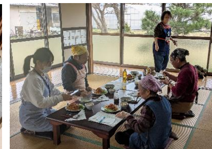
パスタも「簡単おいしい♡」

予告！6/20(金)にバス企画【毎日生まれるたまごを大切に食べるために】茨城乳業株式会社に工場見学に行きます。次号で詳細をお知らせいたします。お楽しみに！