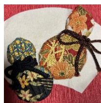
未病とも言われる縁起の良いお飾りです

本来は捨ててしまうものを利用して簡単工作。今回はひょうたんの飾り物をつくります。ごみを減らしてSDGsを楽しく一緒に考えよう。