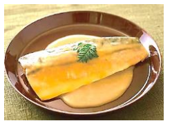
野付の秋鮭 スモークサーモン ←さばの西京味噌煮

■日時：5月28日(水) ■集合：印西牧の原駅7:40または 木下駅8:00 ■解散：木下駅16:00または 印西牧の原駅16:20(予定) ■募集：16名(組合員とその家族) ■参加費：1人2,000円(昼食代含む) ※お振り込みになります ■申込締切：4月19日(土)00:00まで