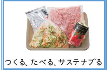
つくる、たべる、サステナブル