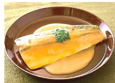
↑ 野付の秋鮭 スモークサーモン ←さばの西京味噌煮